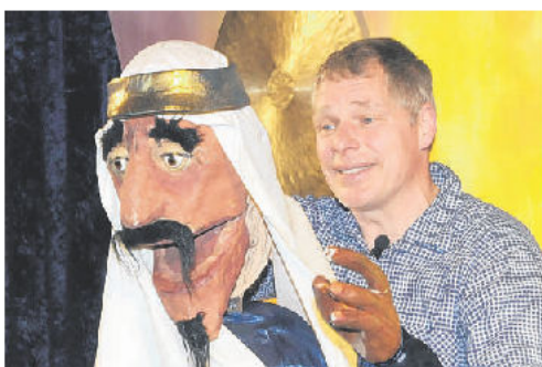
Das Theater Töfte gastierte gestern auf Einladung der Kulturstiftung im Kindergarten Stenkampshof. Am 3. April gibt's die nächste Veranstaltung der Stiftung – dann im Landgasthof Triptrap.

Töfte Theater spielt „Das Kamel aus dem Fingerhut“ im Stenkampshof