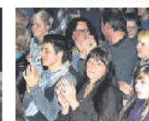
Volles Haus: Das Publikum sparte nicht mit Applaus.