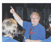
Samba Banana war im GHW ebenfalls zu hören.