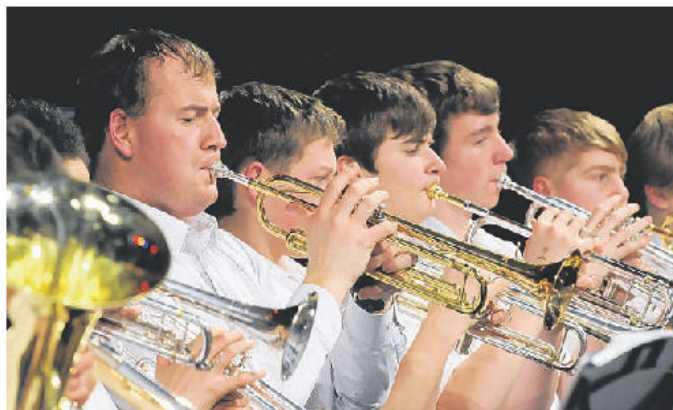
Das Holy Trinity-Schulorchester gestaltete Konzert im Gemeinschaftshaus den musikalischen Auftakt.

An article from Dorsten Paper - WAZ (retyped by Peter Gunther)