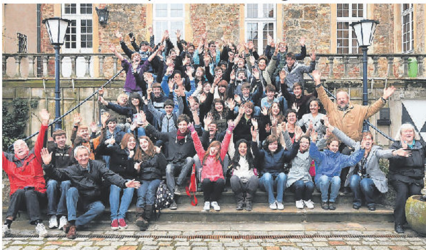
Die Gäste aus Crawley sind gut gelandet und haben am Donnerstag bereits einen ersten Besuch auf Schloss Lembeck gemacht. Was die jungen Musiker der Holy Trinity