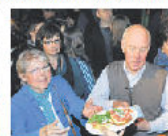
In der Pause ließen es sich die Zuhörer am Buffet gut gehen.